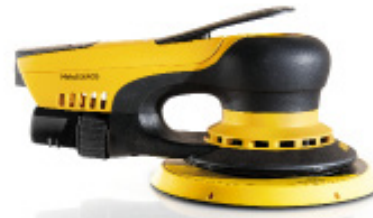
Mirka® DEROS 650CV Ø150 mm, órbita 5 mm